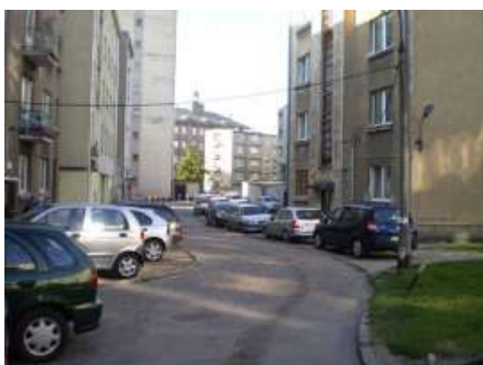
Droga dojazdowa i najbliższe otoczenie