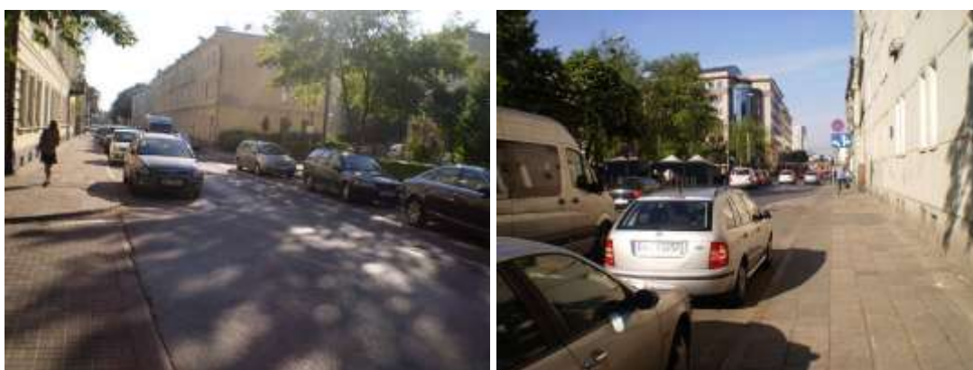
Droga dojazdowa i najbliższe otoczenie