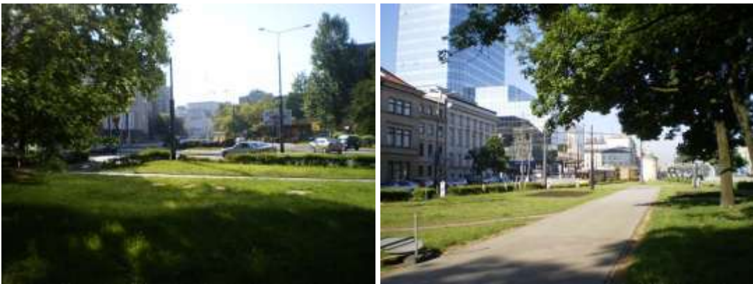
Droga dojazdowa i najbliższe otoczenie