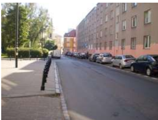
Droga dojazdowa i najbliższe otoczenie