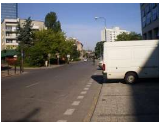
Droga dojazdowa i najbliższe otoczenie