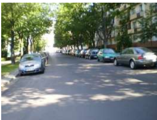
Droga dojazdowa i najbliższe otoczenie