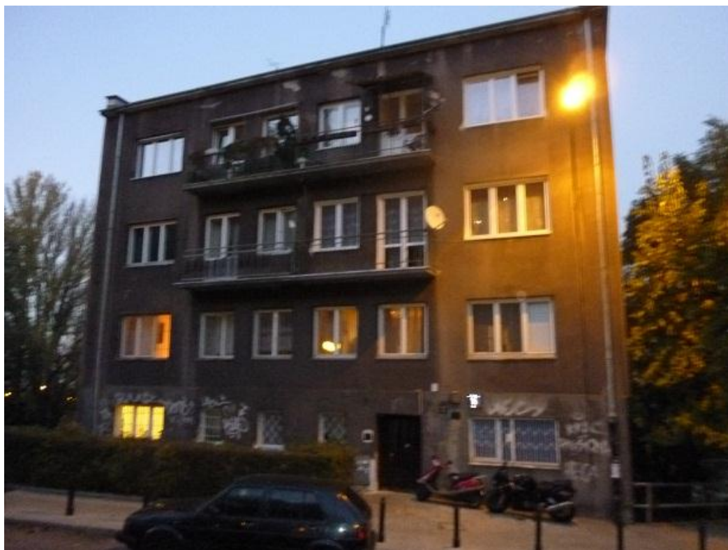
Stan zagospodarowania (wyceniana działka znajduje się bezpośrednio za budynkiem przedstawionym na załączonej fotografii)