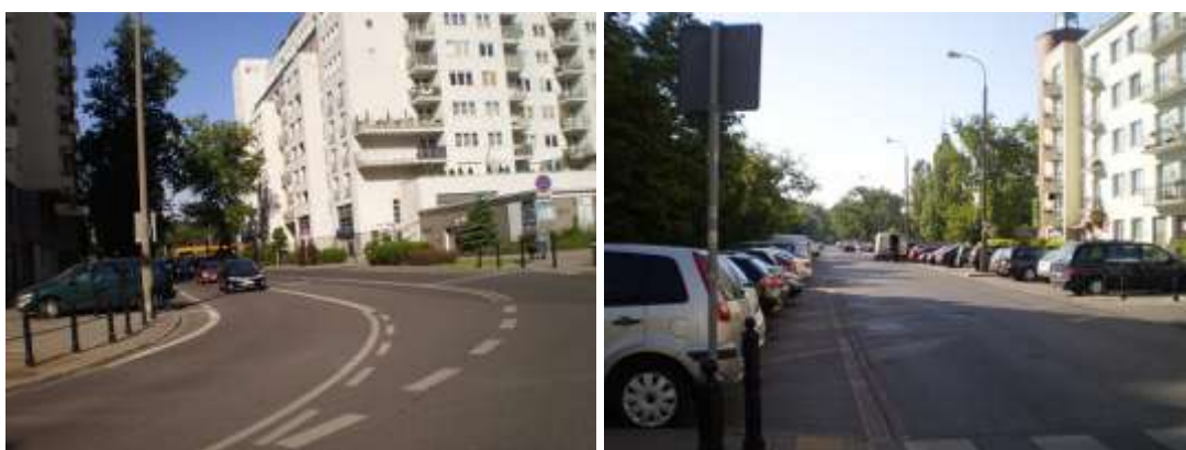
Droga dojazdowa i najbliższe otoczenie