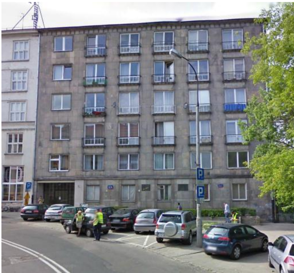
Stan zagospodarowania (wyceniana nieruchomość oraz nieruchomości sąsiednie)