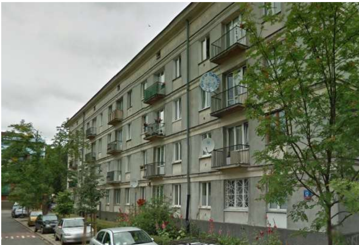
Stan zagospodarowania i otoczenie