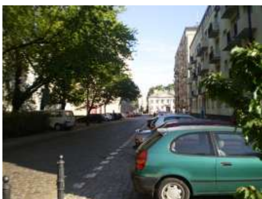
Droga dojazdowa i najbliższe otoczenie