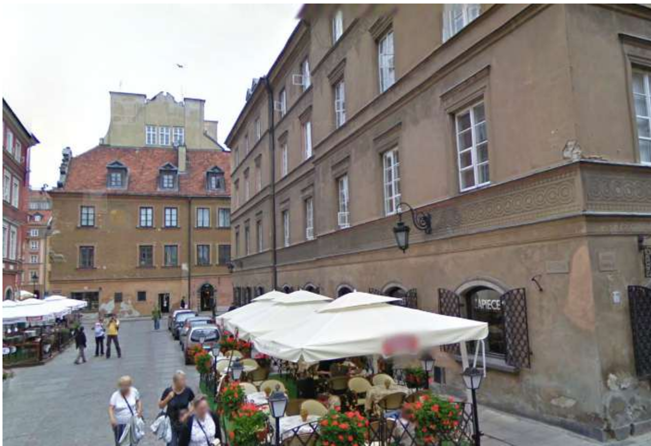
Stan zagospodarowania (fragment istniejącej na gruncie zabudowy oraz otoczenie)