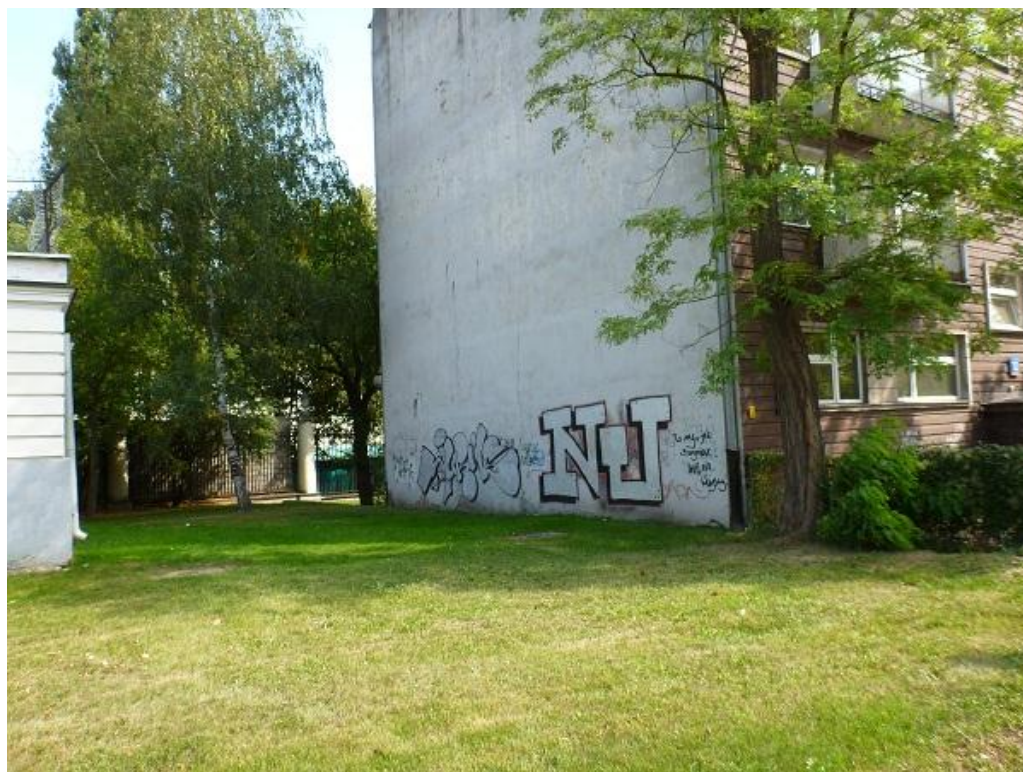
Stan zagospodarowania (wyceniana nieruchomość oraz nieruchomości sąsiednie).