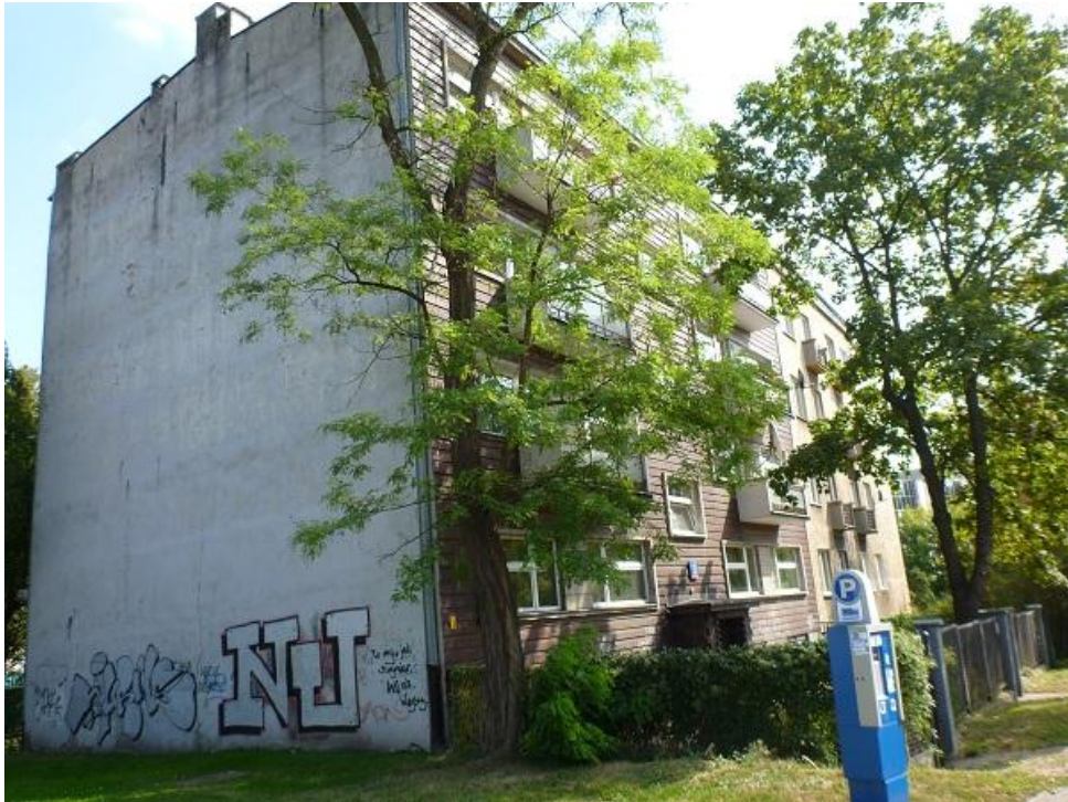
Stan zagospodarowania (wyceniana nieruchomość oraz nieruchomości sąsiednie).