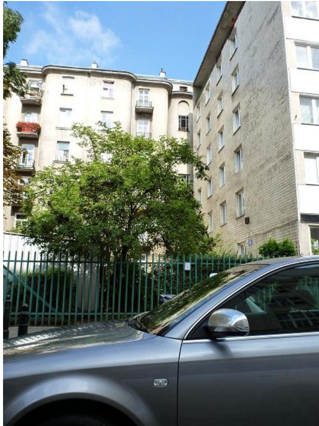
Stan zagospodarowania (wyceniana nieruchomość oraz nieruchomości sąsiednie).